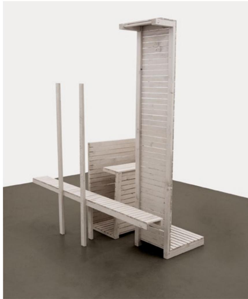
Ingrid Furre, O (artoteksmöbler), 2015