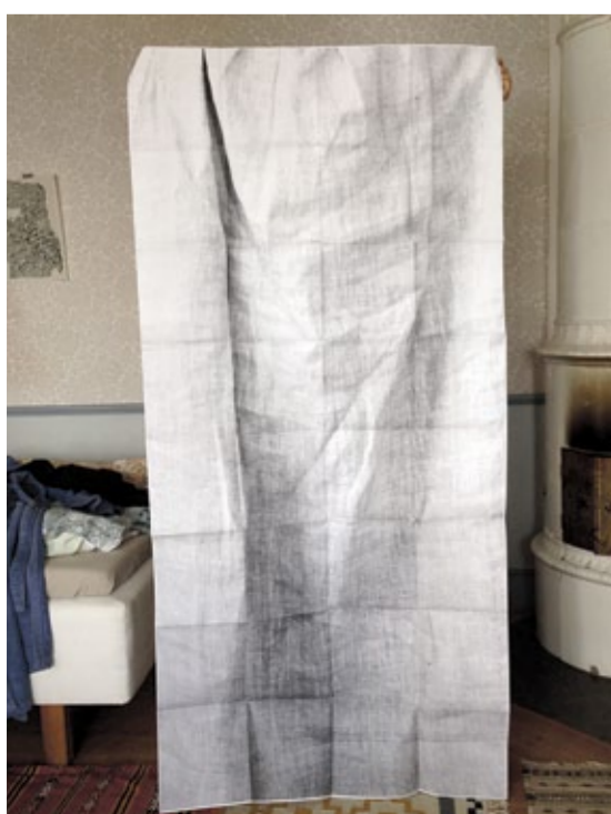
Santiago Mostyn, ILJA'S DRESS, 2010