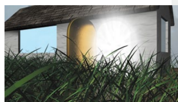
Lily Benson, A TOUR OF THE SELF CLEANING HOUSE, 2014